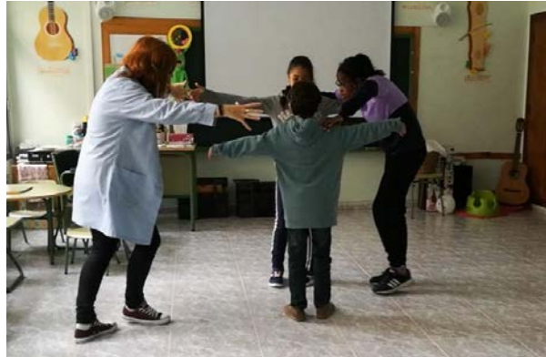
Fig. 21 Inglés y Ritmo Corporal