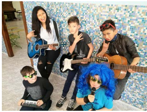
Fig. 20 Dramatización ROCK