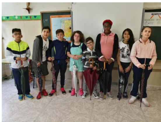
Fig. 16 5º y 6º de Primaria