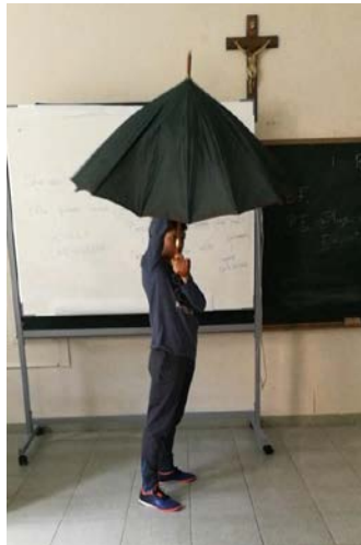
Fig. 22 Inglés y Corporalidad