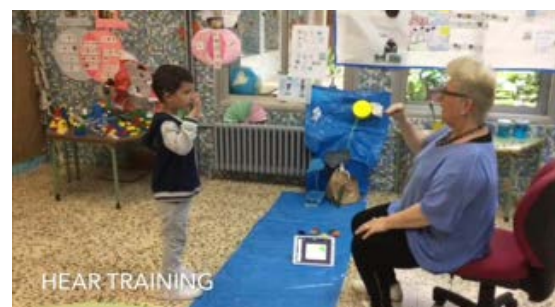
Fig.5 Memorización y producción de las estructuras trabajadas