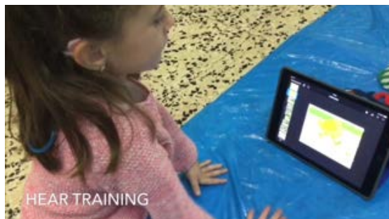
Fig.3 Input visual y auditivo repetición de frases