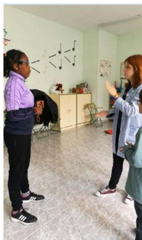
Fig. 19 Inglés y Ritmo Musical