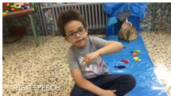
Fig.4 Utilización del cuerpo para memorizar estructuras, haciendo hincapié en la prosodia