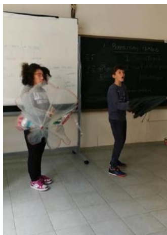
Fig. 23 Ensayando corporalidad