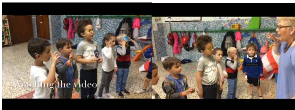
Fig.1 Apoyo de la corporalidad para la producción del habla