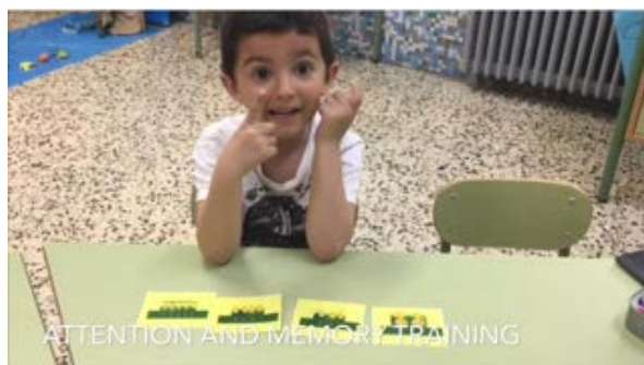
Fig.13 Atención y memoria a través del juego procesos cognitivos fundamentales para el aprendizaje del inglés.