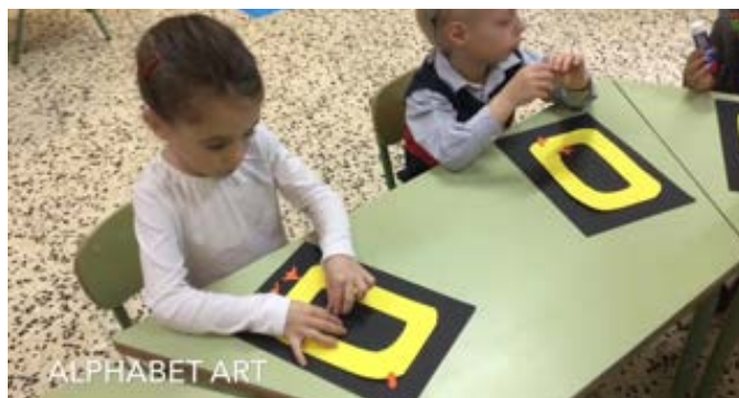
Fig.14 Ejemplo de nuestro Alphabet art

Para finalizar el producto final un cuadro de Alphabet art.