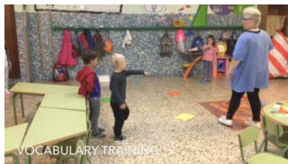
Fig.9 Identificación; espacio y movimiento claves para el aprendizaje