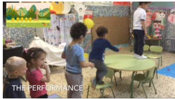
Fig.6 Dramatización para la integración de frases musicales