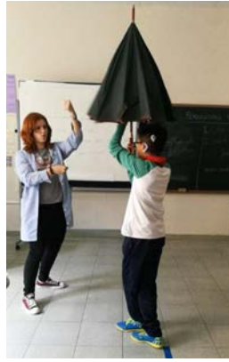
Fig. 24 Ritmo Corporal con el objeto