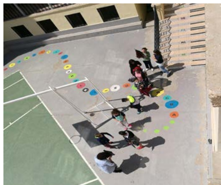
Fig. 26 Dramatización final