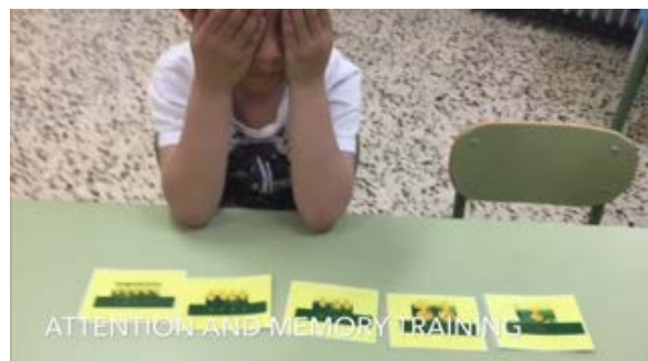
Fig.12 Atención y memoria a través del juego procesos cognitivos fundamentales para el aprendizaje del inglés