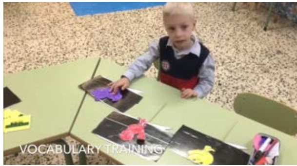
Fig. 10 Identificación; trabajo previo al reconocimiento

Al mismo tiempo, las dinámicas para la integración de los conceptos y contenidos trabajados contemplan el desarrollo de procesos cognitivos (atención, memoria, análisis, síntesis) que se refuerzan en todas las áreas curriculares y especialmente en ésta dirigida a la adquisición y desarrollo de los diferentes aspectos que conforman la lengua: prerrequisitos, prosodia, fonética, léxico, semántica, sintaxis y pragmática, indispensables para la adquisición de la lengua inglesa.