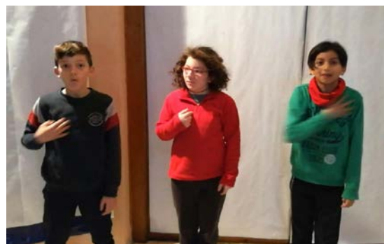
Fig. 18 Inglés y lengua de signos