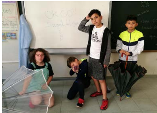
Fig. 25 Disfrutando con la dramatización