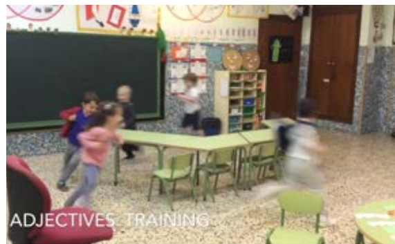
Fig.8 Espacio y movimiento claves para el aprendizaje