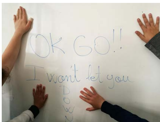
Fig.17 Conciencia del lenguaje escrito