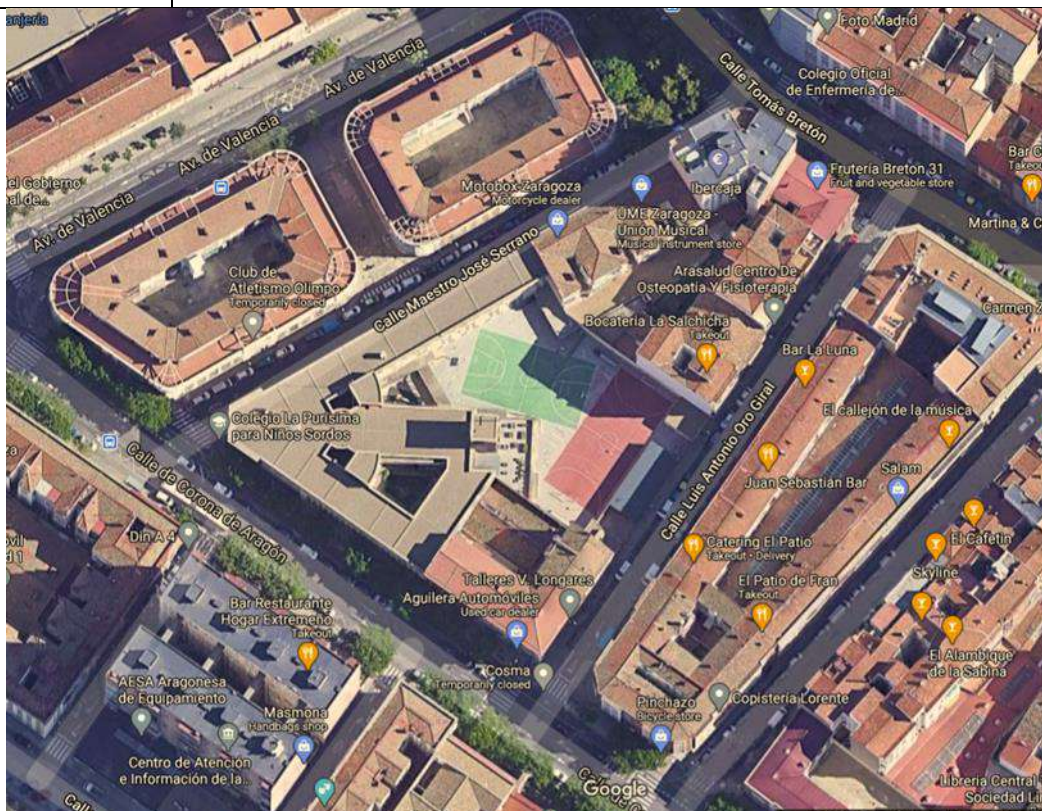
Plano de situación del centro educativo y señalización de entrada en Calle Luis Oro Giral

La actividad de acogida de alumnado se planificará desde las Coordinaciones, siendo muy cuidadosos en el respeto de los Grupos Estables de Convivencia.