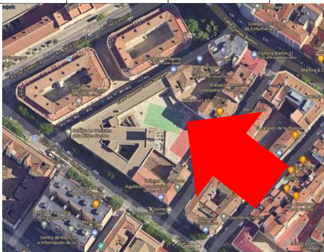
Plano de situación del centro educativo y señalización de entrada en Calle Luis Oro Giral

La actividad de acogida de alumnado se planificará desde las Coordinaciones, siendo muy cuidadosos en el respeto de los Grupos Estables de Convivencia.